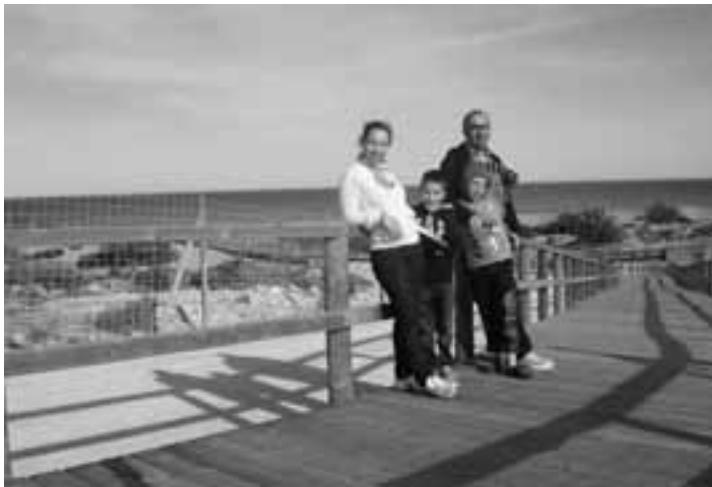
Regjåla gångbroar av trä gör det lättare att nå stranden.