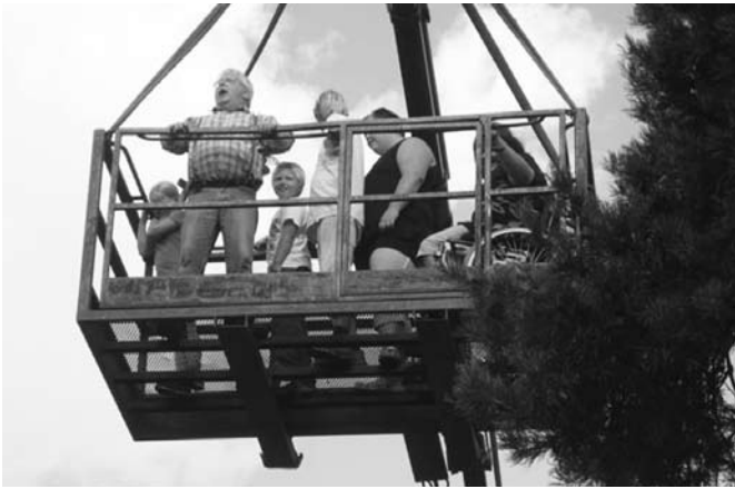
Världens bästa Karlsson

Om vädrets makter inte var med oss på fredagen så var det i varje fall med oss på lördagen - det var strålände sol och lekens dag....förutsättningarna var bra. Massor av barn hade kommit till Furuboda och flera olika aktiviteter fanns att roa sig med hela dagen. Både Karlsson på taket och Pippi var på plats.